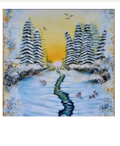
AMY-LEE GRACE VOGEL

„Laster der Menschheit“ – Die sieben Todsünden in zeitgenössischer Bildsprache MORAL · PSYCHOLOGIE · SYMBOLIK