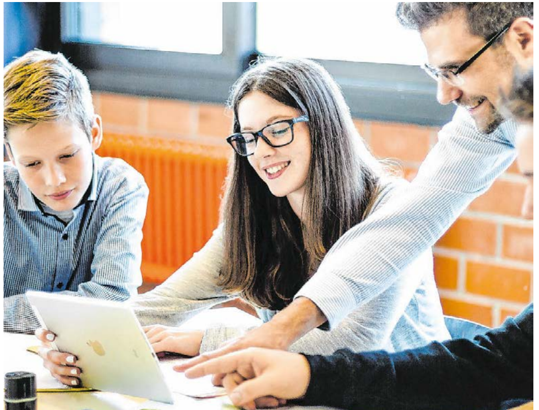
Moderner Unterricht: An der Gesamtschule spielen moderne Medien eine immer größer werdende Rolle.